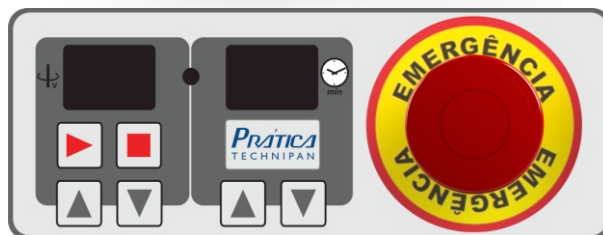
Panel de Comando com LED, telas indicadoras, teclas de toque e botão parada de emergência.